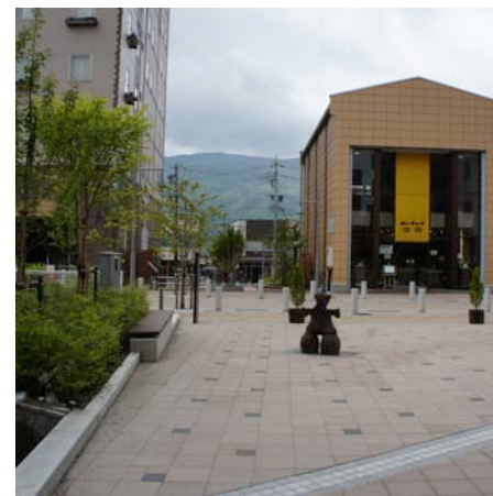
水路・道路・公園の調和した一体感のあるイベント空間