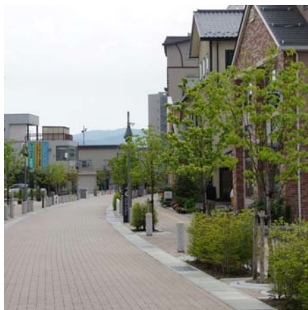
商店街に相応しい暖かみを加味した弥生通り