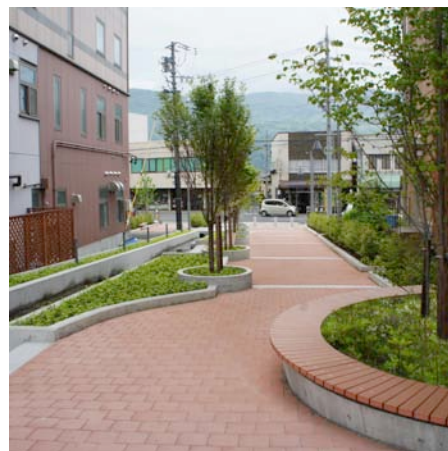
弥生通りと上川橋線をつなぐバリアフリーな歩行者専用道路