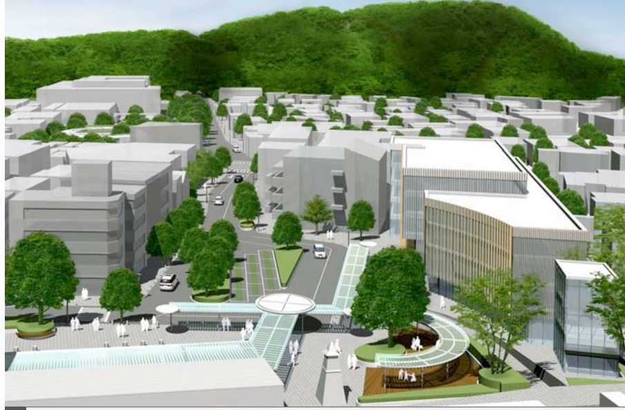
「路ひろば」駅前の交流のシンボル ~西口駅前広場~

所在地: 神奈川県鎌倉市 主催者: (財)都市づくりパブリックデザインセンター 期間: 2006年 対象地区: 鎌倉駅西口(約1.2ha) テーマ: 古都鎌倉の玄関口にふさわしい質の高い生活空間と活力ある地域交流拠点の整備 賞: (財)都市づくりパブリックデザインセンター会長賞