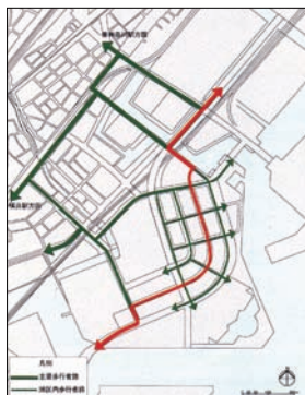
歩行者空間ネットワーク