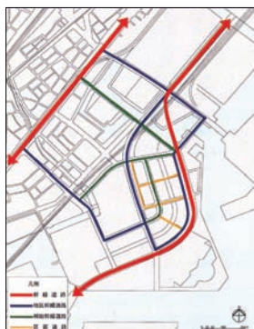
道路ネットワーク